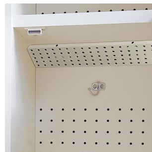
サンクリーンボード