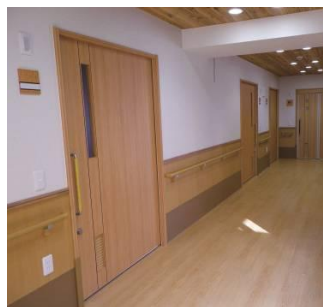
木質系複合 軽量引き戸 「エコロドア」