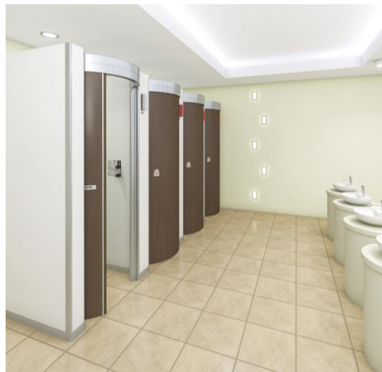
※2021年1月現在当社調べ

三和シャッター工業はお客様の多様なニーズにお応えできるよう、安全・安心・快適を提供することにより社会に貢献するという使命のもとに、お客様の視点に立った商品を今後も提供してまいります。