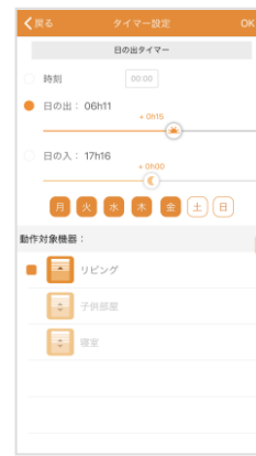
タイマー設定画面