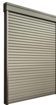
閉鎖状態 フラットで スタイリッシュなデザイン 業界最大の耐風圧性能

新型コロナウイルス感染症をはじめとした感染症の感染リスクを低減させるためには、換気によって密閉空間を防ぐことが推奨されています。また、近年の ZEH(ネット・ゼロ・エネルギー・ハウス)など省エネルギー住宅への関心により、通風や遮熱機能などを備えた住宅部材のニーズが高まっています。