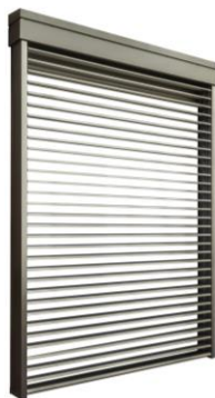
ブラインド状態 換気で感染予防

三和シャッター工業株式会社(本社:東京都板橋区/社長:高山盟司)は、ブラインド機能を備えた住宅用窓シャッターにフラット形状の新型スラットを採用した「マドモアブラインド エフ F」を1月29日より発売します。