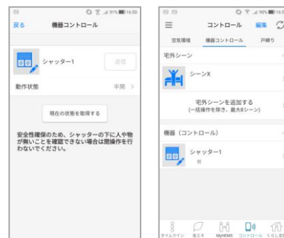
電動窓シャッター操作画面(スマートフォン)

また、それに伴う安全対策としてアプリから窓シャッターを閉鎖操作した場合には、挟まれ・締め出し防止として操作画面に注意喚起が表示されるだけでなく、閉鎖を予告するブザーが20秒間鳴動する設定を追加しました。