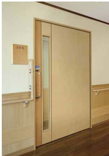
木質系軽量引き戸 「スムード 木楽（きらく）」

※上記に記載されている情報は、発表日現在のものです。 予告無く仕様、価格など変更する場合がありますので、あらかじめご了承ください。