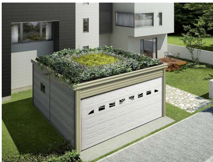
カポレージ用緑化システム「コフレガーデン」