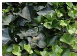
ヘデラ ヘリックス