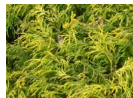
フィリフェラ オーレア