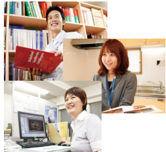
お客様の新しい暮らしのカタチを、お客様と一緒に築いていきます。

日々の暮らしで、不便や不満を感じているところ、これからの理想とする生活像などをぜひ私共にお話ください。