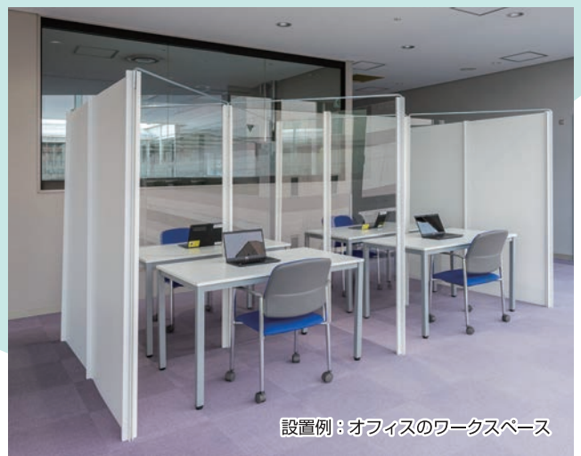
設置例：オフィスのワークスペース

ポスト（支柱）にパネルや補強材を差し込むだけで簡単に組み立てられます。使わないときは、ばらして保管しておくことで、必要なときに繰返しお使いいただけます。