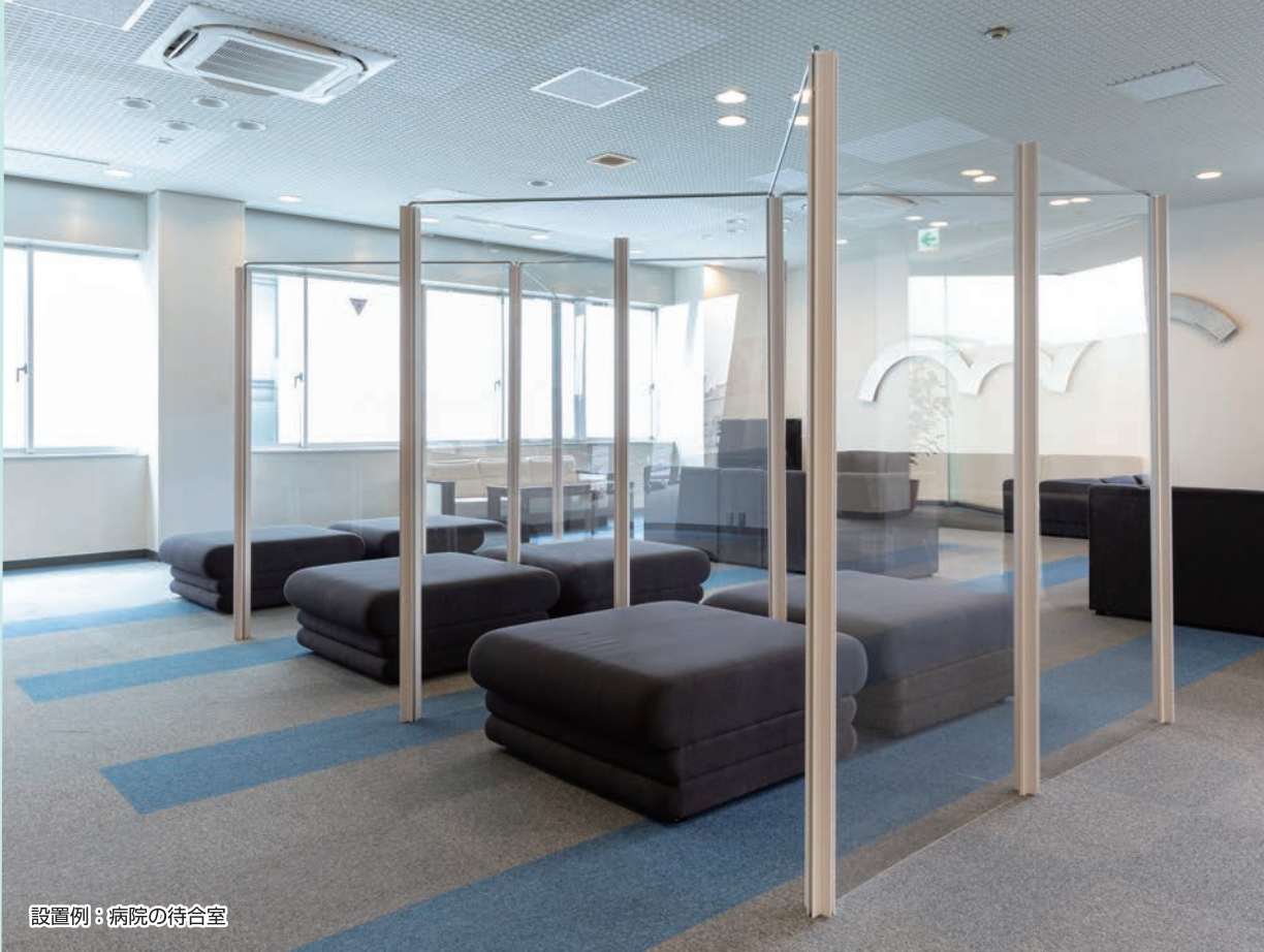
設置例：病院の待合室

病院の待合室やオフィスの打合せスペースなどに、『ファミプラ』の新しい使い方をご提案。人と人が密になる状況の抑止と、パネルによる飛沫防止で、安心な環境をつくり出します。透明パネルと白色の目隠しパネルは、設置場所に応じて組み合わせ枚数を自由に設定できます。