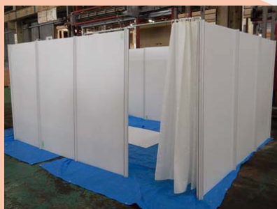
4人用基本ユニット カーテン(オプション)使用例

ユニットは2人用、3人用、 4人用を取り揃えており、 様々な家族構成に対応可能。