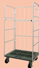
カゴ車(オプション)