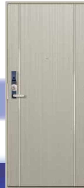
セレドールパルビオ