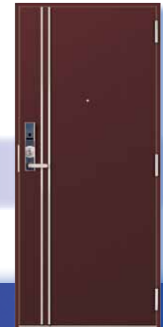
エルマーノセレクト