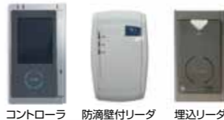
コントローラ 防滴壁付リーダ 埋込リーダ

カードの登録と抹消ができる多機能リーダは3種類。miniSDを利用して履歴を記録できるため、スタンドアロンでの運用も可能です。通信機能を使って集中管理に活用することもでき、防滴壁付リーダは屋外にも設置できます。