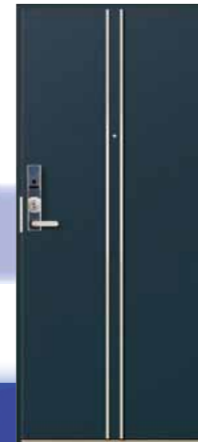
セレドールエルマーノ