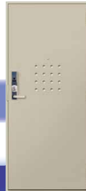
エルマーノセレクト